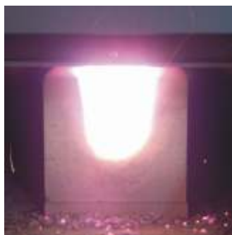
Pogled v zgorevalno komoro